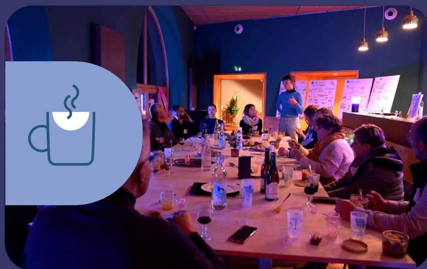
RÉSEAUX ET LIENS LOCAUX