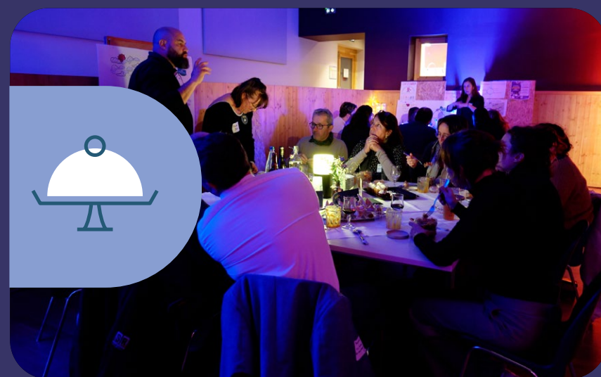
RESTAURATION COLLECTIVE DURABLE ET LOCALE