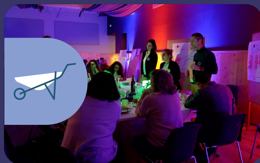
VALORISATION DES DÉCHETS PROS