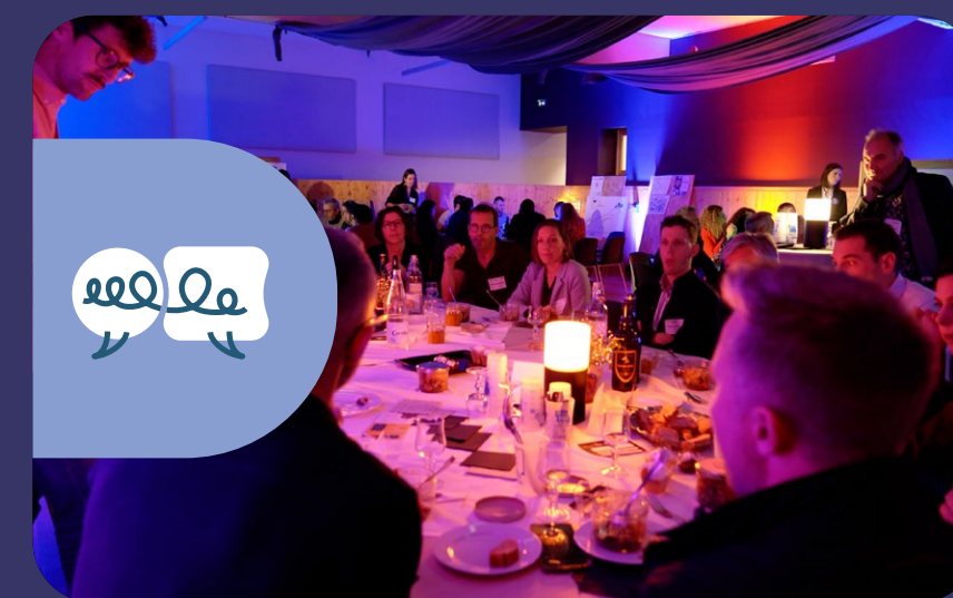
QUALITÉ DE VIE ET DES CONDITIONS DE TRAVAIL (QVCT) EN ZONE FRONTALIÈRE