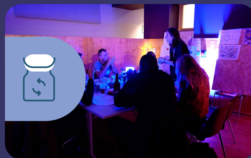
RÉEMPLOI LOCAL DE CONTENANTS