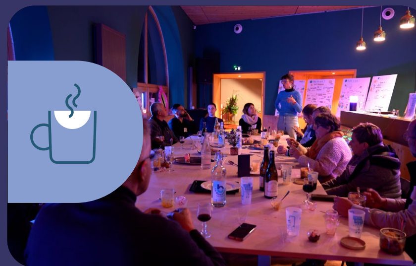
RÉSEAUX ET LIENS LOCAUX